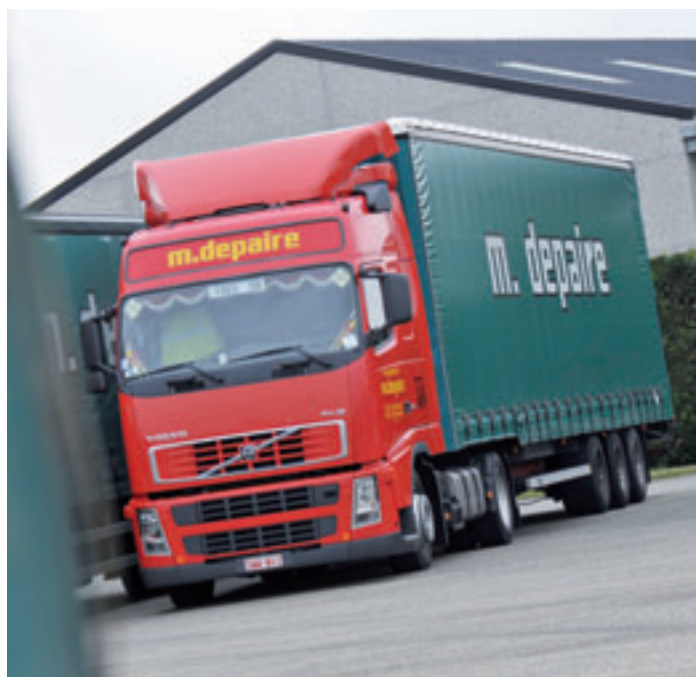
Le parc se répartit entre deux marques : Volvo et Renault.