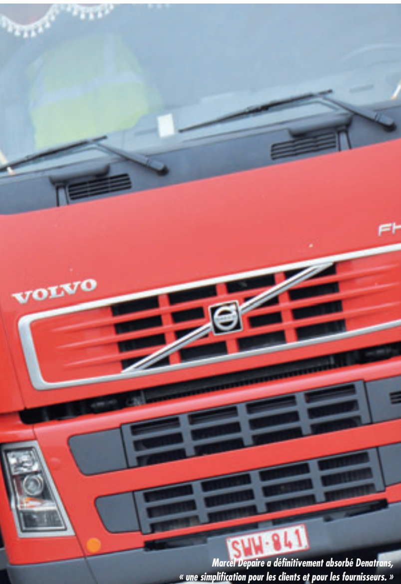
Marcel Depaire a définitivement absorbé Denatrans, « une simplification pour les clients et pour les fournisseurs. »

financiers. Est-ce qu'un indépendant qui se lance dans le transport a calculé ses besoins en fonds de roulement ?